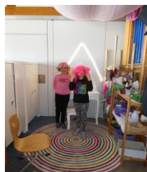
Schmink- und Verkleidungsecke