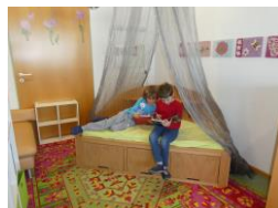
Chill und Lesecke